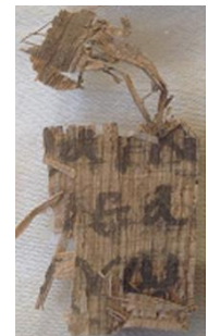
1 Juan 2:21