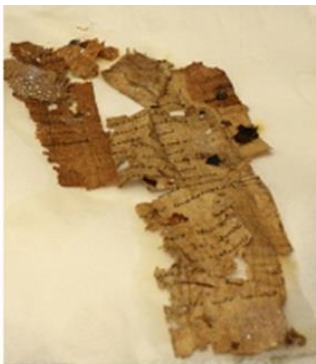
Papyri recovered from inside of mask