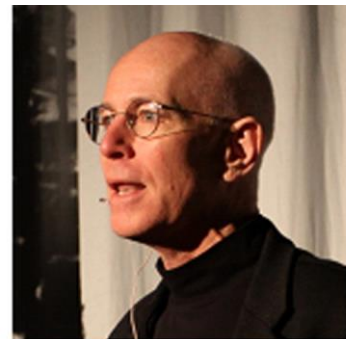
Father Columba Stewart

En el segundo día de las reuniones, el día en el que me enteraría qué tesoro se hallaba entre nuestro cartonaje antiguo, le tocó hablar al sacerdote Columba Stewart, quien es el director ejecutivo del Museo y Biblioteca de Manuscritos Hill, de la Universidad Saint John, en Collegeville, Minnesota. Explicó cómo él y sus colegas tienen bajo su protección manuscritos antiguos de todo el mundo y que los fotografían para su preservación. Su ministerio ha sido fundamental para fotografiar más de cuarenta mil manuscritos. Describió los peligros de entrar en países desgarrados y devastados por guerras en los que dominan los terroristas. Quedé sorprendido al enterarme de que al coordinar equipos de personas de cada localidad este ministerio continúa preservando alrededor de cinco mil manuscritos por año.