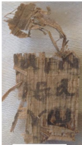
1 Juan 2:21

Caminé hacia la mesa y contemplé los fragmentos que son de color beige, y luego ligeramente pasé mis dedos sobre ellos. Estaba conmovido por la emoción. En realidad Dios había contestado mis oraciones. Me recordó de la emoción que sentí cuando por primera vez vi un manuscrito antiguo con texto bíblico y del enorme impacto que tuvo en mí.